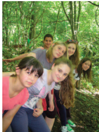
Prechádzka po čerstvom vzduchu