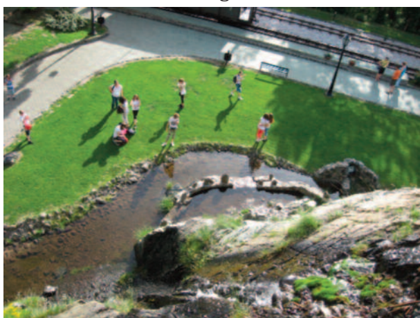
Jedna zo zastávok na Šarganskej osmičke