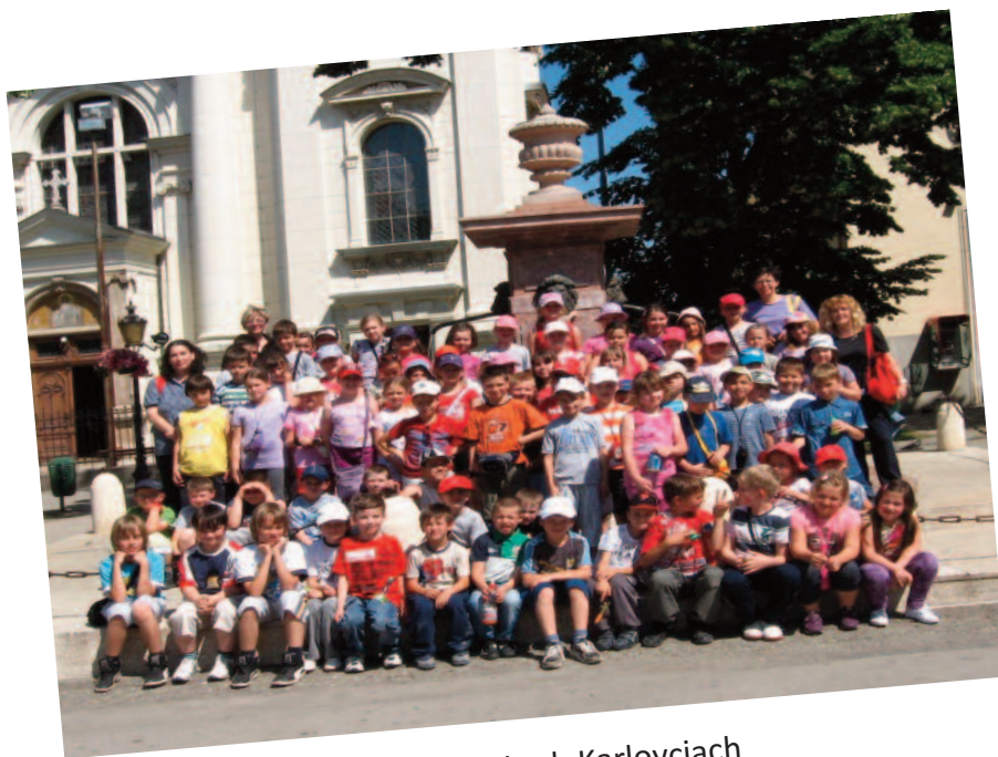
V Sremských Karlovcích