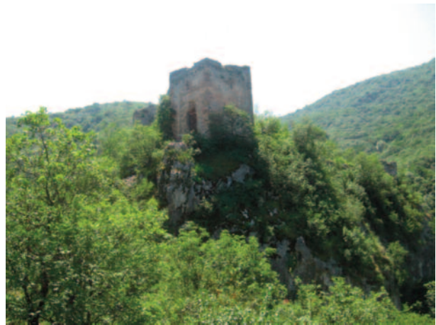
Ukrytý v horách - Sokograd