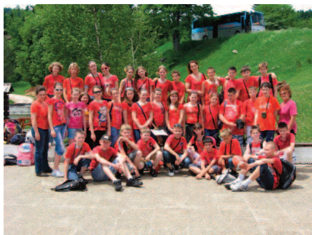
Spoločná fotka pred odchodom