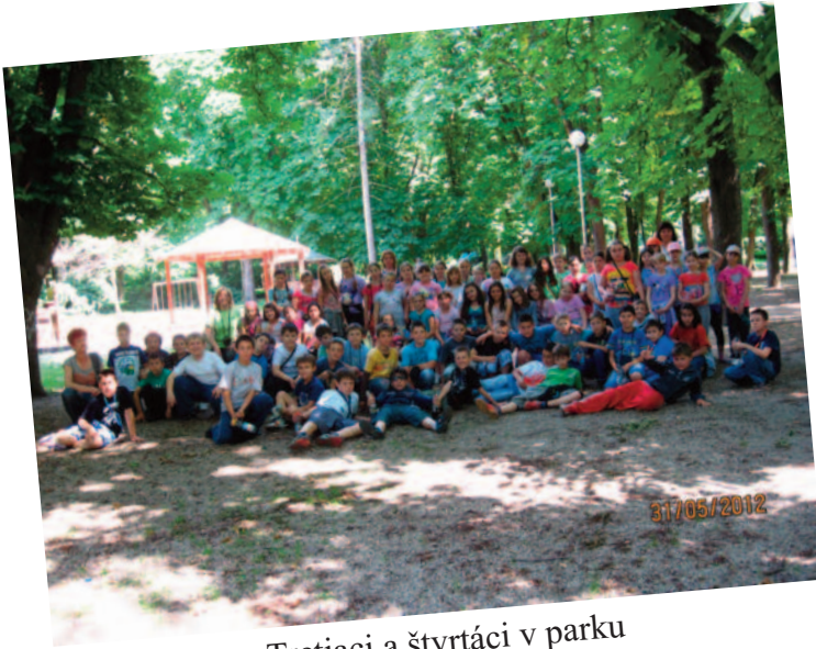
Tretiaci a štvrtáci v parku