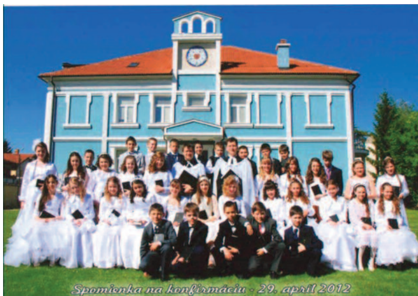
Spoločná fotografia žiakov piateho ročníka

Koncom januára sme my, piataci, začali chodiť na kamarátenie konfirmantov. Boli tam deti aj z iných škôl. S pánom farárom sme mali hodiny náboženstva.