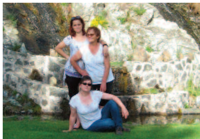
Tu sú aj triedne učiteľky