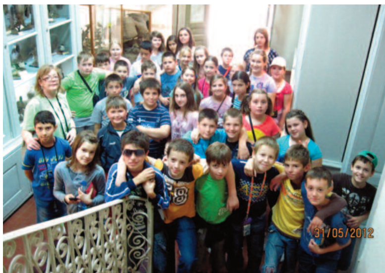
Štvrtáci v múzeu