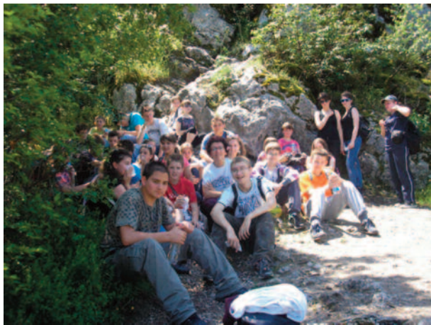
Oddych v lese