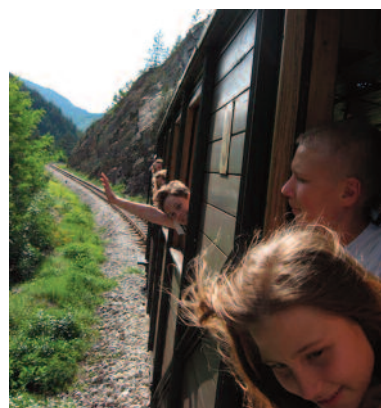
Obzeráme Taru z vlaku