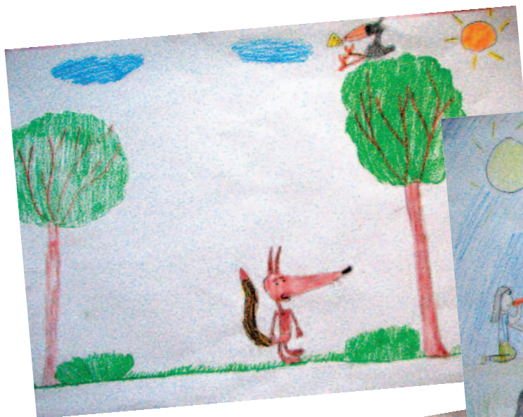
Alexej Uher, 2.1