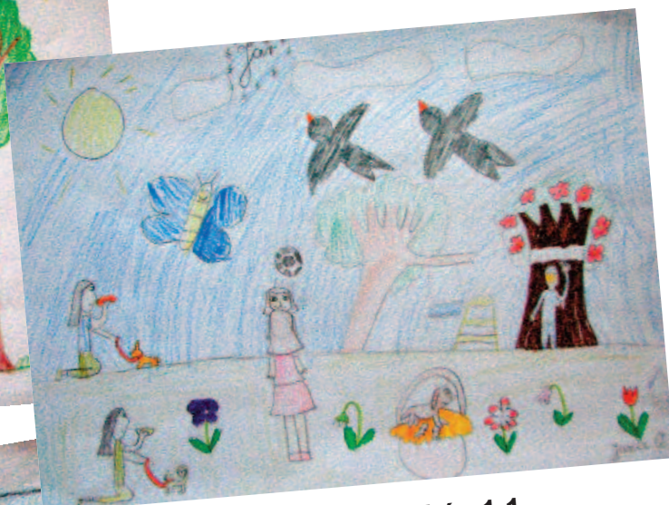
Jana Opavská, 1.1