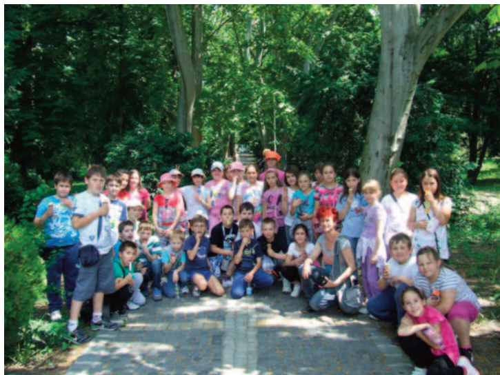
Tretiaci v parku