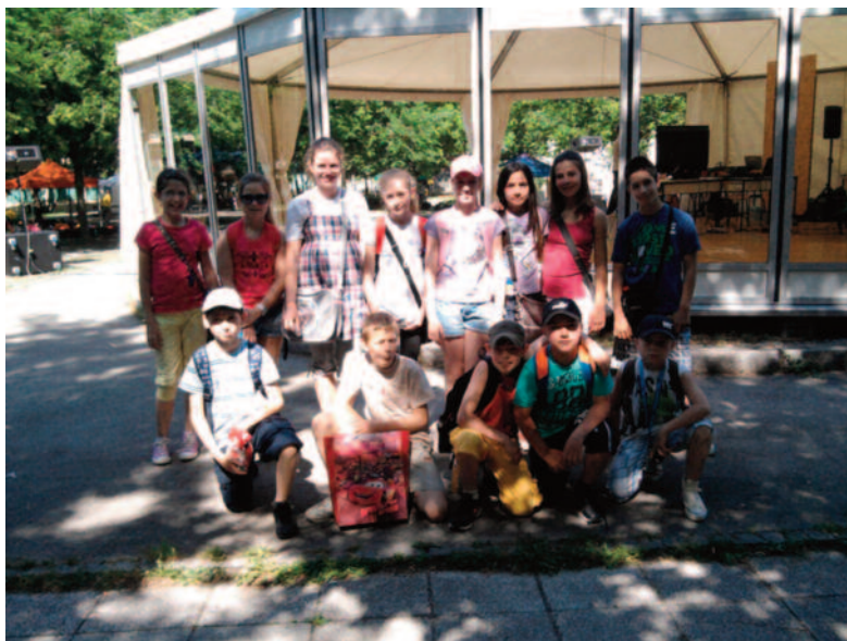
Piataci v Novom Sade

V sobotu 12. mája 2012 žiaci vyšších ročníkov a ich prednášatelia navštívili Festival vedy v Novom Sade. Bol to ozajstný zážitok. Boli v planetáriu, v Zmaj-Jovovej ulici a v Mc-Donaldse. Domov sa vrátili šťastní a plní zážitkov.