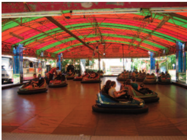
Ved' počkaj, predbehnem ťa!!!