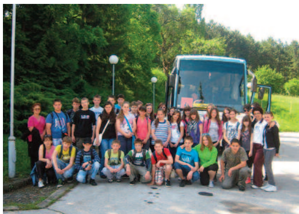
Všetko pekné má svoj koniec