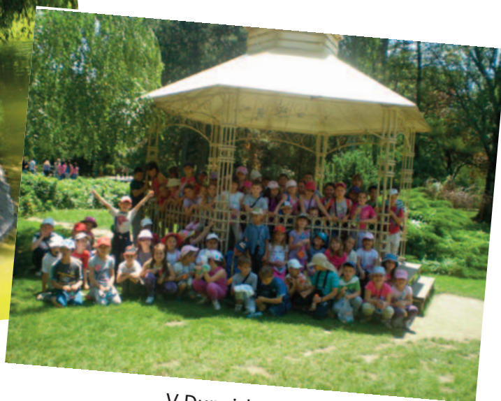
V Dunajskom parku