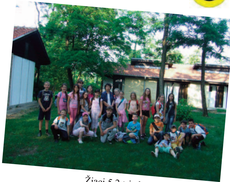
Žiaci 5.2 triedy