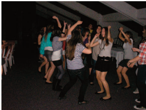
Párty v diskotéke