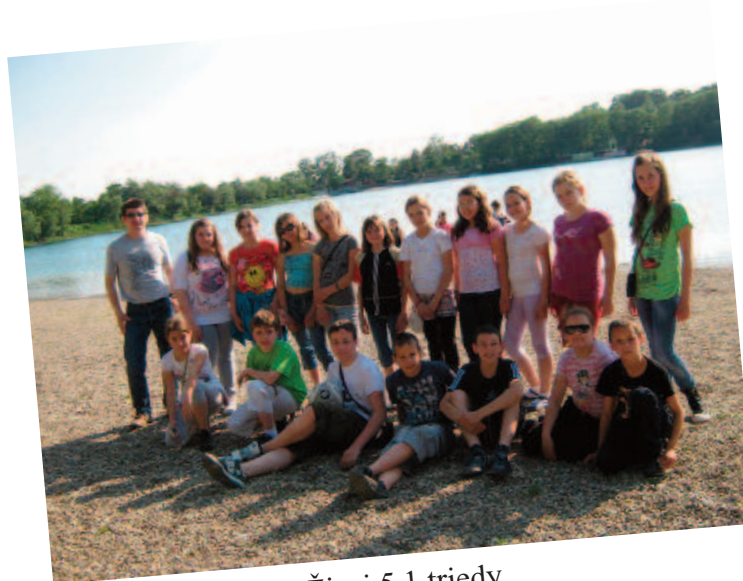
Žiaci 5.1 triedy

Po viacerých odročniach pohli sme sa na výlet do Vršcu. Pohli sme sa o ôsmej hodine ráno. Všetci sme sa veľmi tešili.