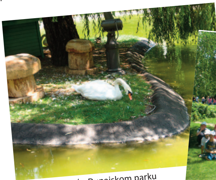
Labuť v Dunajskom parku