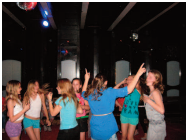
V diskotéke nám bolo veselo