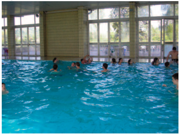
Kúpanie v bazéne