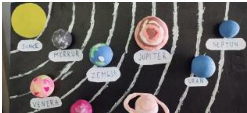
Dávid Vujašević, 8.1