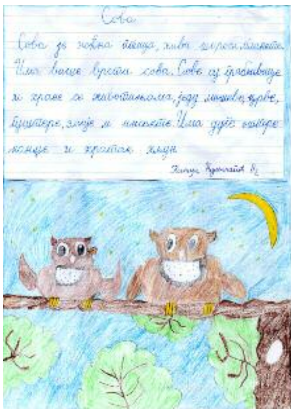
Лена Станковић, 7.1