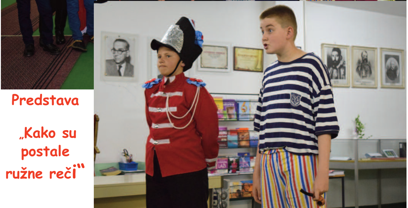
Predstava „Kako su postale ružne reči“