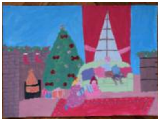
Klára Fitošová 3. 2