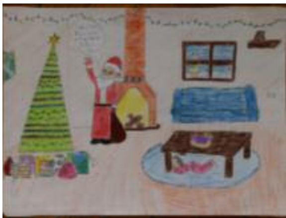
Andrea Opavská 3. 2