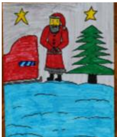
Braňo Fábry 2. 2