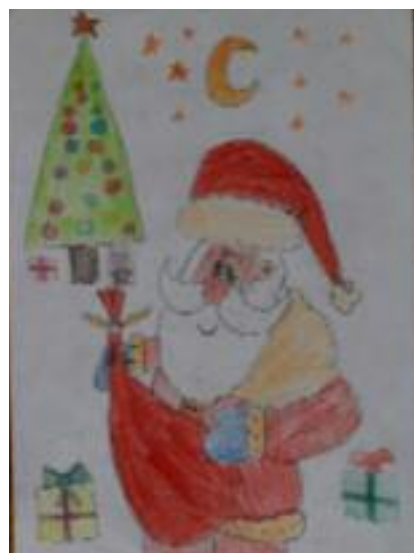
Jana Molnárová 2. 2