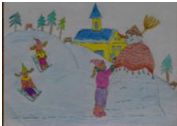
Emanuella Šipická-Šagyová 1. 2