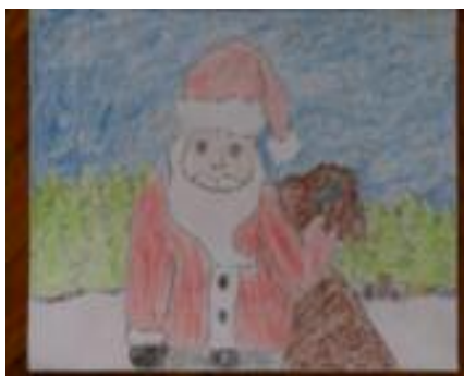
Aňa Gubečková 4. 2