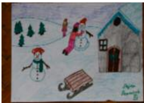
Dejna Domoniová 4. 1