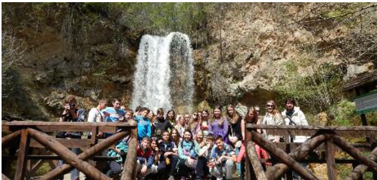
Pri vodopádoch Lisine