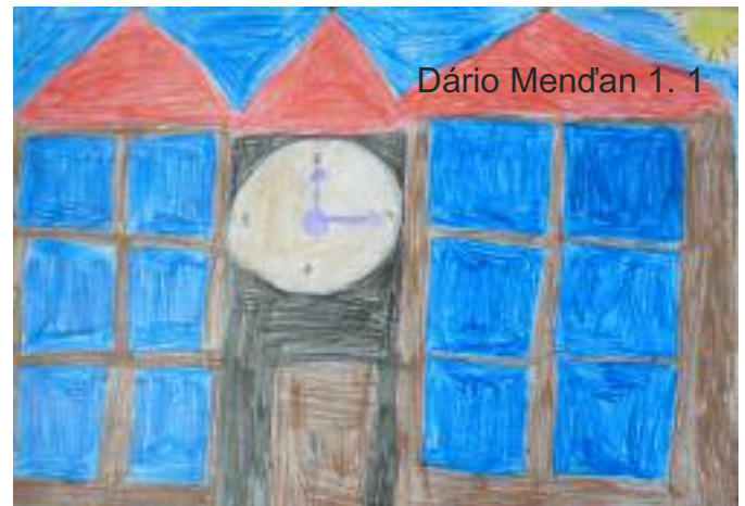
Dário Mend'an 1. 1