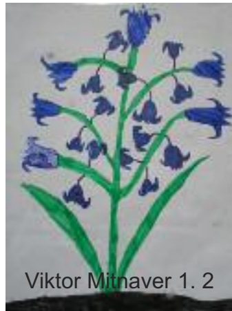
Viktor Mitraver 1. 2