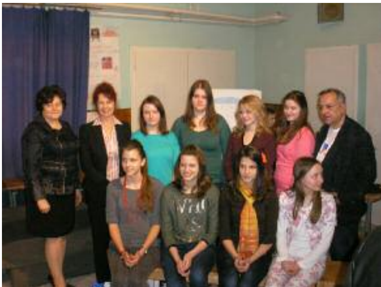
Najúspešnejšie žiačky literárnej súťaže Čo dokáže pekné slovo a Komisia pre literárnu činnosť Výboru pre kultúru NRSNM