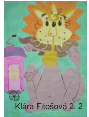
Klára Fitošová 2. 2