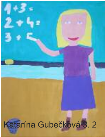
Katarína Gubečková 3. 2