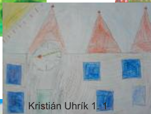
Kristián Uhrík 1. 1