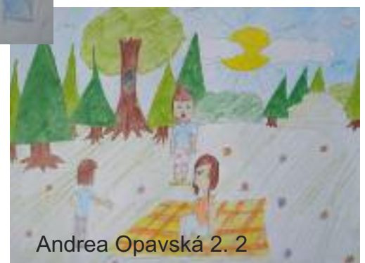
Andrea Opavská 2. 2