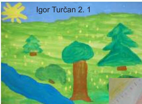
Igor Turčan 2. 1