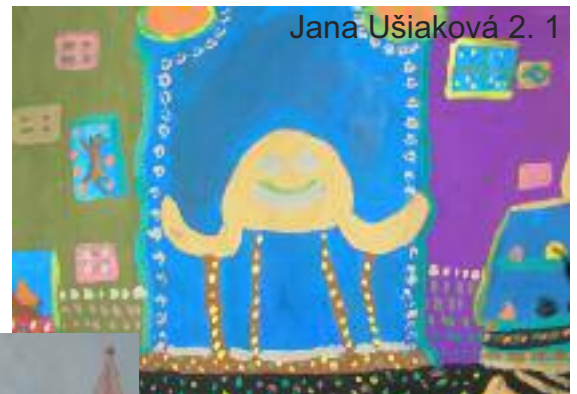
Jana Ušiaková 2. 1